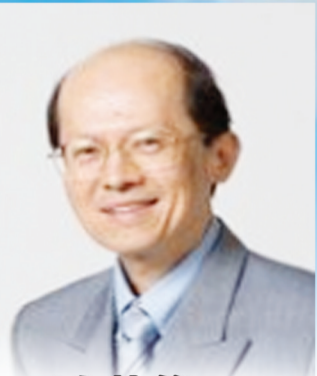
新加坡陈英俊医生供稿