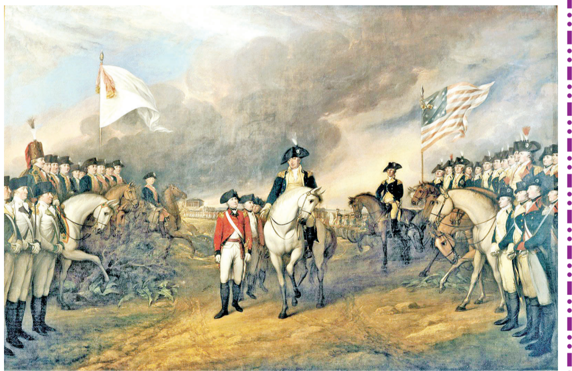
康沃利斯勋爵在约克镇向乔治-华盛顿投降

“离开了上帝,便无法治国平天下。”“各民族,应当承认全能上帝的护理和主宰,服从祂的旨意,感谢祂的恩惠,并且谦卑地祈求祂的保佑与恩宠。”“上帝对我们美国的国事,特别关垂;其在革命运动中,尤其可以看到上帝大能的作为。我非常痛心,我们国民竟有好些人已经忘记了全能的上帝对于我们眷爱护佑的大恩。如此忘恩负义,实在比那些不信的无神论者更为不忠,更为不义。”华氏在其致各州州长的公函中有一段话说:“无论从政治方面,道德方面,物质方面来看,我们对于上帝的眷爱,均应感恩庆幸。”“上帝对于我们美国特